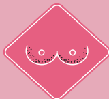
PIEL DE NARANJA