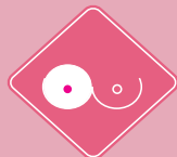
ENROJECIMIENTO O ARDOR