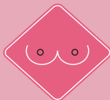
HUNDIMIENTO DE PEZÓN