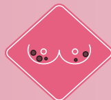
EROSIONES EN LA PIEL